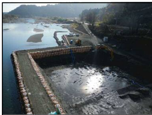
① 護床ブロック流出状況