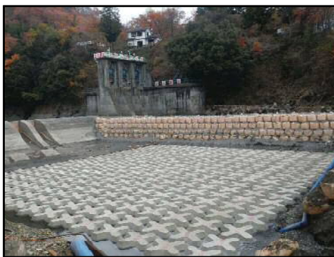
② 護床ブロック設置