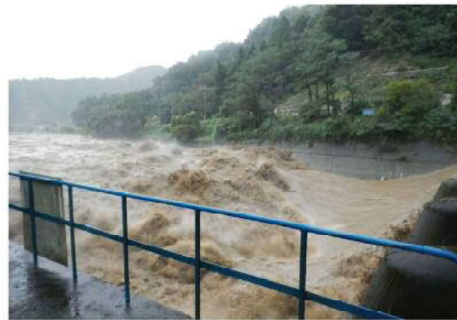
台風 18 号豪雨（H25.9.15～16）

前年度までに固定堰上流部工事（1 期工事）、固定堰下部及び下流部の復旧工事（2 期工事）が完了し、平成 28 年 3 月に下流部の護床ブロック設置工事（3 期工事）をもって、安曇川合同井堰の復旧工事は全て完了いたしました。