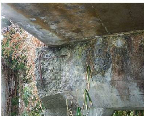
左岸幹線用水路水路橋の コンクリート剥離・鉄筋腐食状況

調査の目的は、今後土地改良施設の改修を事業化するにあたり、現在未整備水路区間（安曇川町上古賀～下古賀地先）の詳細な調査を行うものです。平成24・25年度で調査を実施し、早急に事業採択されるよう、県・市の協力を得ながら、土地改良施設の適切な更新整備を進めてまいります。